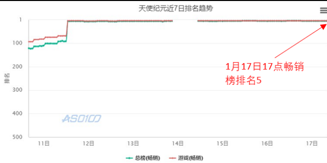
图 1 iOS 畅销榜《天使纪元》7 日排名