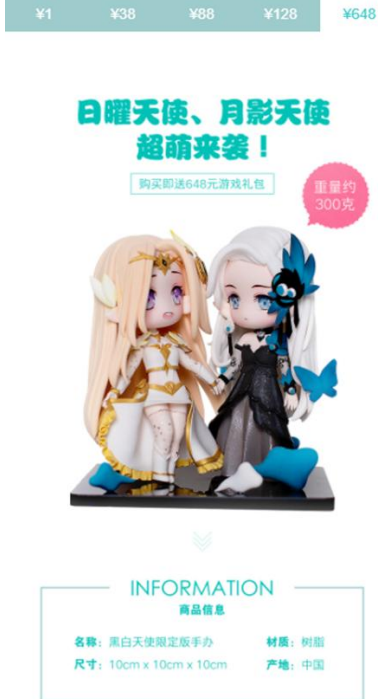
图 11 《天使纪元》周边商城产品