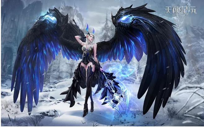
图 7 《天使纪元》原画