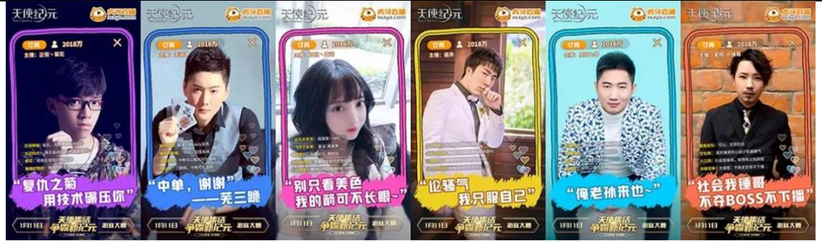
图 9 《天使纪元》与虎牙 6 大主播联动