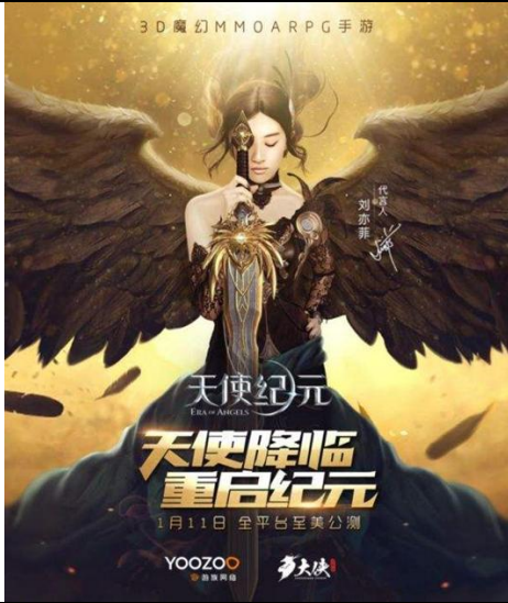
图 1 《天使纪元》刘亦菲形象海报